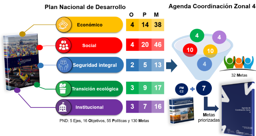
Gráfico 2. Proceso de priorización