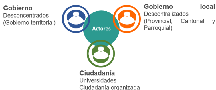
Gráfico 4. Actores de las mesas técnicas

Elaboración: Dirección Zonal de Planificación 4, Secretaría Nacional de Planificación.