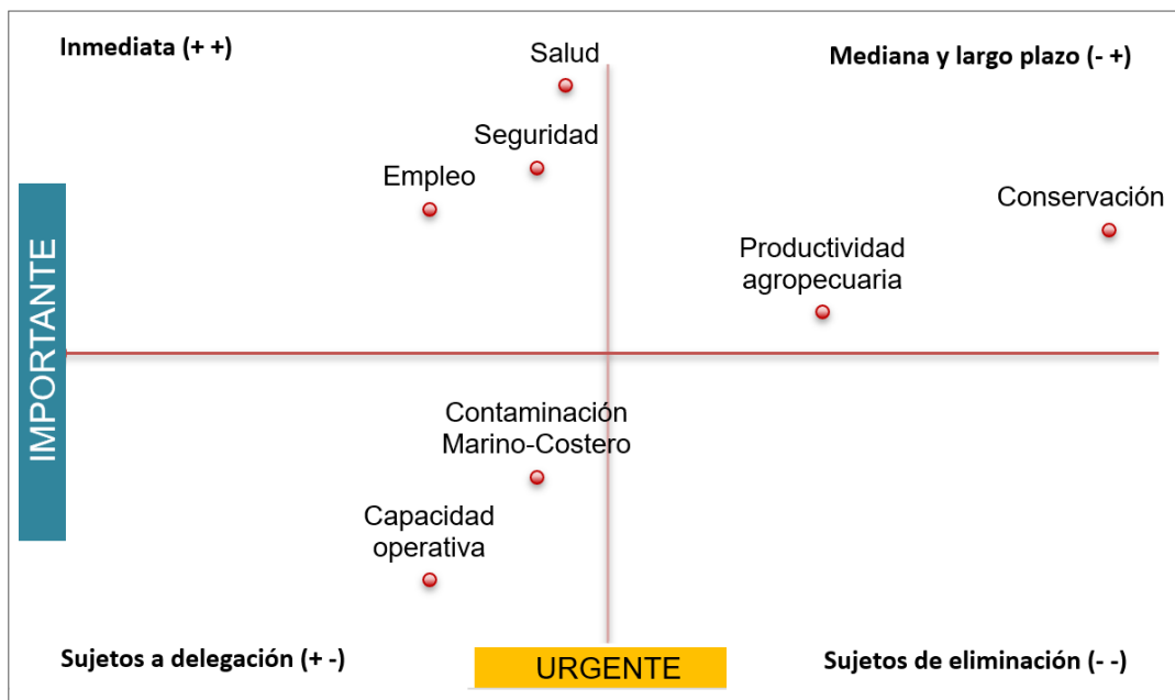
Gráfico 3. Prioridades territoriales en la Zona de Planificación 4